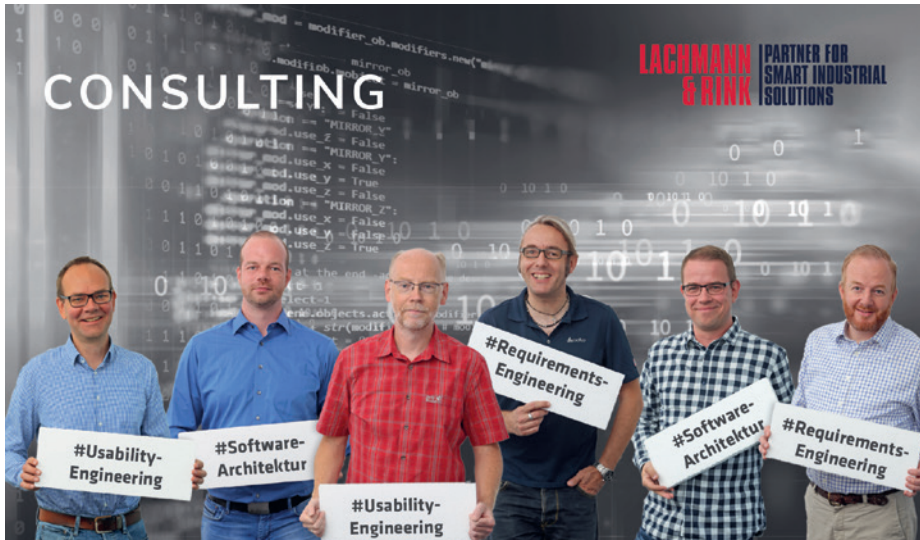
Consulting – schon sehr früh sucht man das Gespräch mit den Kunden, um gemeinsam Herausforderungen zu meistern

hier eine hierarchieübergreifende Feedback-Kultur implementiert; jeder kann seine Meinung sagen und Ideen einbringen. Eine offene Kommunikation und Transparenz sind essenziell.